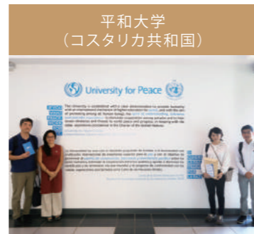
平和大学を教員が訪問