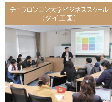
チュラロンコン大学ナッタ先生来日講演