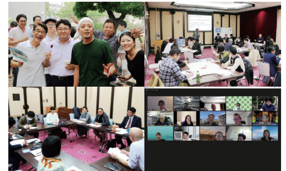
(左上から時計回り) ホームカミングデイ (親睦会)、シンポジウム (ビジネス協奏会)、横山塾 (勉強会)、理事会