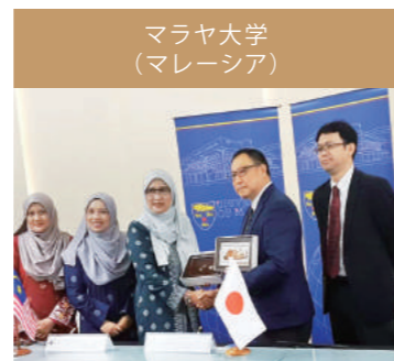
マラヤ大学調印式 (マラヤ大学にて)